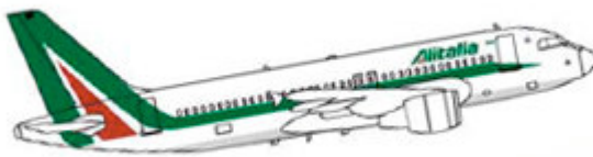
flotta_airbus320 Airbus 320