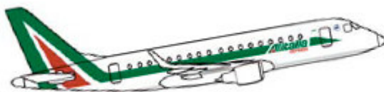
flotta_embraer170 Embraer 170