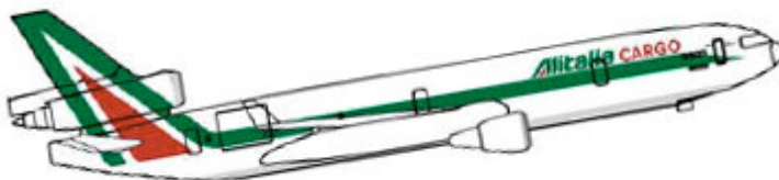
flotta_md11 MD-11 Cargo