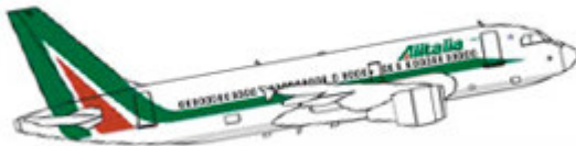
flotta_airbus319 Airbus 319