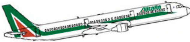
flotta_airbus321 Airbus 321